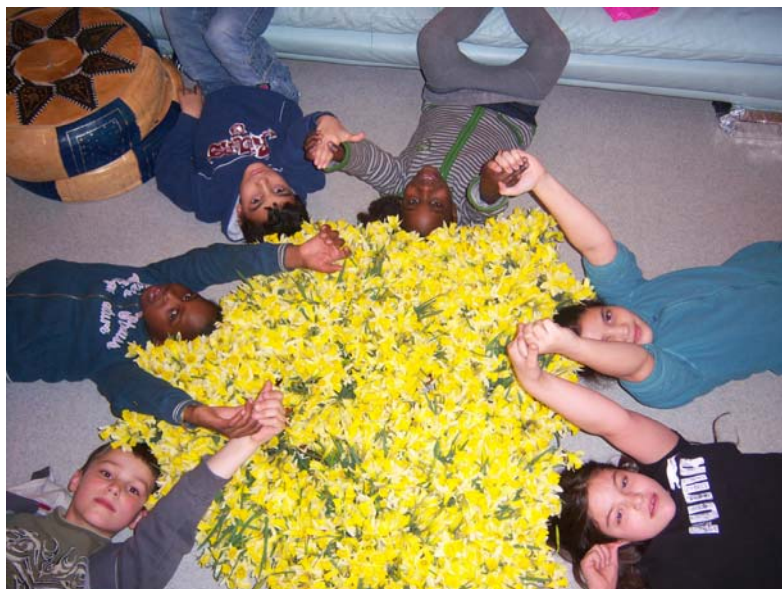
Les copains du monde de Pontault ont cueilli des jonquilles. Avec l'argent des bouquets, vendus sur le marché ; on achètera une chèvre pour les bébés mauritaniens